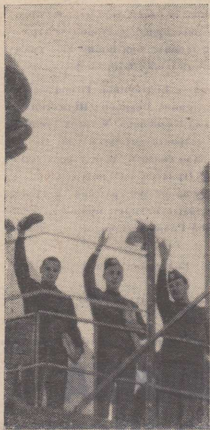
Байконур. 6 июня. Экипаж космического корабля «Союз-11» перед стартом.

Л ЕГЕНДАРНЫЙ ДАНКО с горящим сердцем в руках—такова эмблема Всесоюзной художественной лотереи, ставшая ныне известной во многих городах и селах. «Искусство—народу», «Красоту—в каждый дом»—эти лозунги завоевали широкую популярность, в том числе и у сельских ценителей прекрасного.